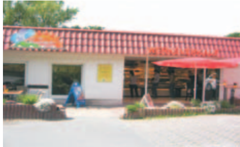
Werksverkauf, Jena Brückenstr. 4

Goethogalerie Markt 24 Burgaupark Drackendorf-Center Camburger Straße im Lidl-Markt Erlanger Allee 102 im Netto-Markt Anna-Siemsen-Straße 31 Heinrich-Heine-Straße im Netto-Markt Rudolstädter Straße im Lidl-Markt Columbus-Center