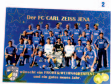
FCC Jahreskalender + Adventskalender Setpreis: 15,00 €