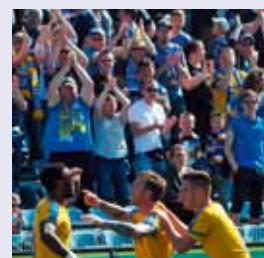
Rückhalt: Auf die Fans ist beim FC Carl Zeiss Jena immer Verlass.