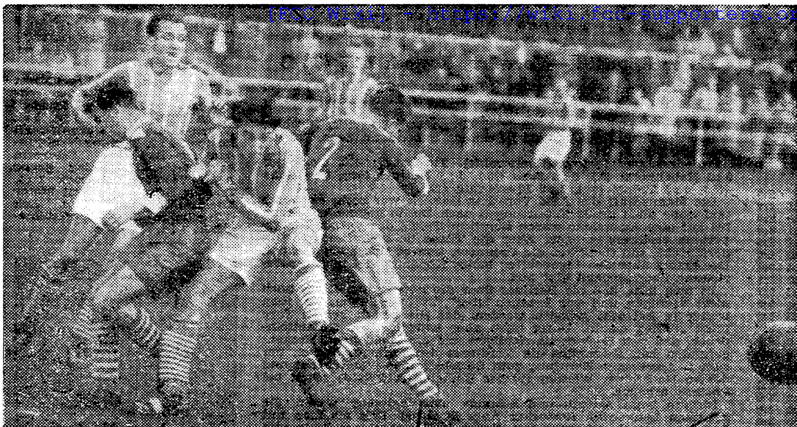
Zwei wertvolle Punkte entführte Dynamo Hohenschönhausen aus Zeit. Völlig verdient gewannen die Männer um Herbert Schoen bei sehr konzentriertem Spiel diesen Kampf gegen den Oberliga-Absteiger. Unser Foto stammt aus dem Vorjahr vom Spiel Dynamos gegen SC Motor Karl-Marx-Stadt (1:1).