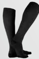
VenoTrain® business KOMPRESSIONSSTRÜMPFE