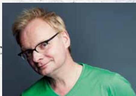
Uwe Steimle Jena | 17.09.2016