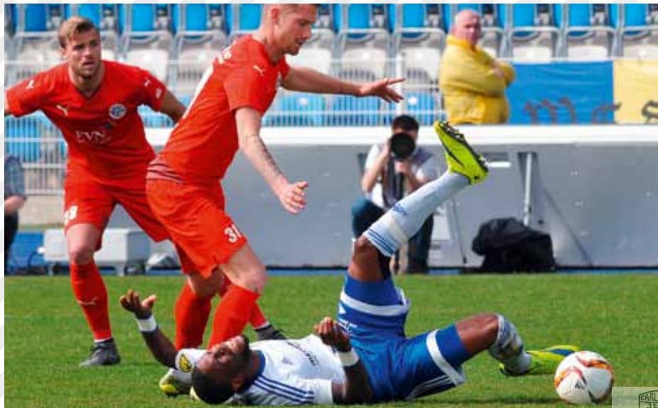
Pechvogel Bedi Buval vergab in der 67. Minute die größte Chance für den FC Carl Zeiss.