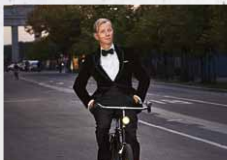
Max Raabe & Palast Orchester Jena | 11.11.2016