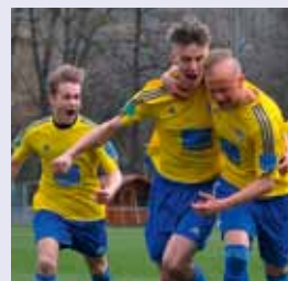
Berlin, Berlin, wir fahren nach Berlin: Die Jenaer U19 steht im DFB-Pokalfinale.