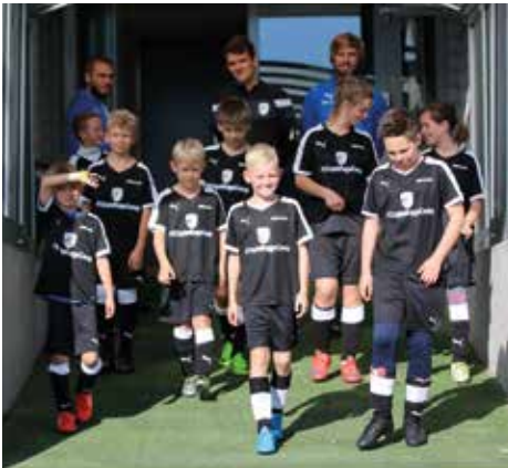
Einmal wie die Profis aus dem Spielertunnel aufs Spielfeld laufen. Das FCCspieltagsCamp macht es möglich.

Nach der zweiten fußballerischen Lehrstunde des Tages ging es schließlich erneut auf die Haupttribüne, von wo die FCCspieltagsCamp-Kinder dann an der Seite ihrer Eltern den Sieg ihrer Idole über Rostock feierten.