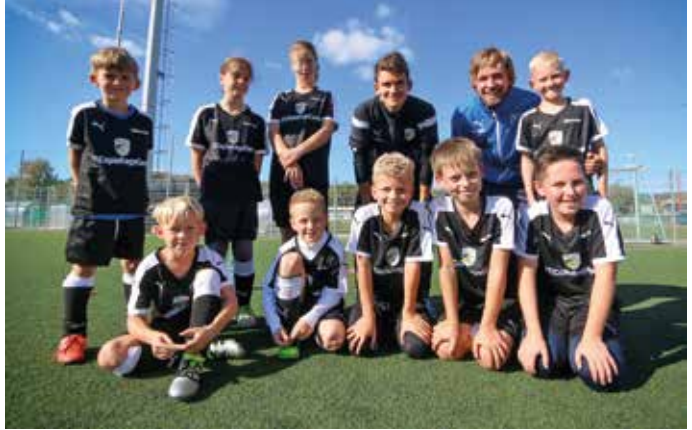
Kleine Stars ganz groß. Bei herrlichem Wetter erlebten die Kids einen tollen Tag und den Drittligaerfolg unseres FCC live von der Tribüne aus.

Spannend war der anschließende Rundgang durch das Stadion: Ein kurzer Besuch in der VIP-Lounge, danach eine Tour entlang der Medienarbeitsplätze von Fernsehen, Radio und Presse auf der Haupttri-