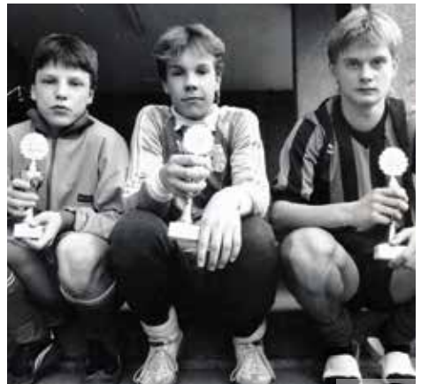
Robert Enke (Mitte) sammelte schon früh Pokale mit dem FC Carl Zeiss Jena.